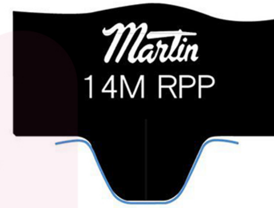
TIMING BELT 皮帶輪量規